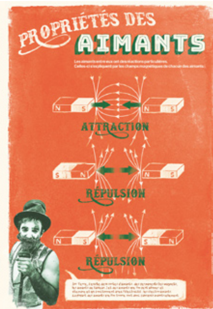
Les affiches pédagogiques pour approfondir quelques notions. Graphisme: Mélanie Vialaneix