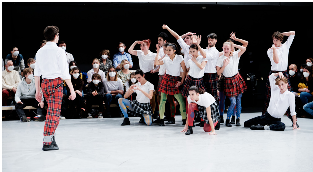
Kamuyot , Ohad Naharin BOnR

Le public a pris place dans les gradins installés en vis-à-vis pour délimiter l'espace d'une scène improvisée au centre d'un gymnase. Il n'y a ni décor, ni rideau, rien du décorum habituel des salles de théâtre. Un coup de sifflet strident retentit et le show commence. Quatorze danseurs survoltés, un peu rebelles, déboulent de tous les côtés, kilts sur collants déchirés pour les filles, pantalons en tartan pour les garçons. L'instant d'avant, certains d'entre eux étaient encore assis incognito au milieu des spectateurs. Figures et styles s'enchaînent avec la même énergie débordante sur des musiques toutes aussi éclectiques – pop japonaise psychédélique, bandes originales de séries, reggae et sonate de Beethoven. Une ode à la jeunesse et une joie partagée entre les artistes et le public.