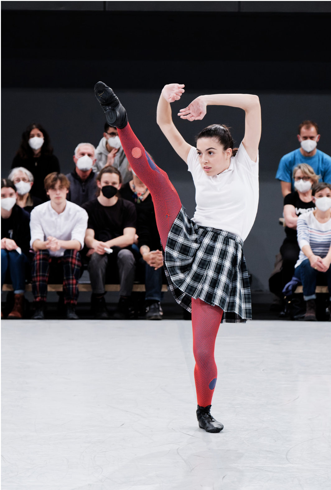
Kamuyot , Ohad Naharin BOnR