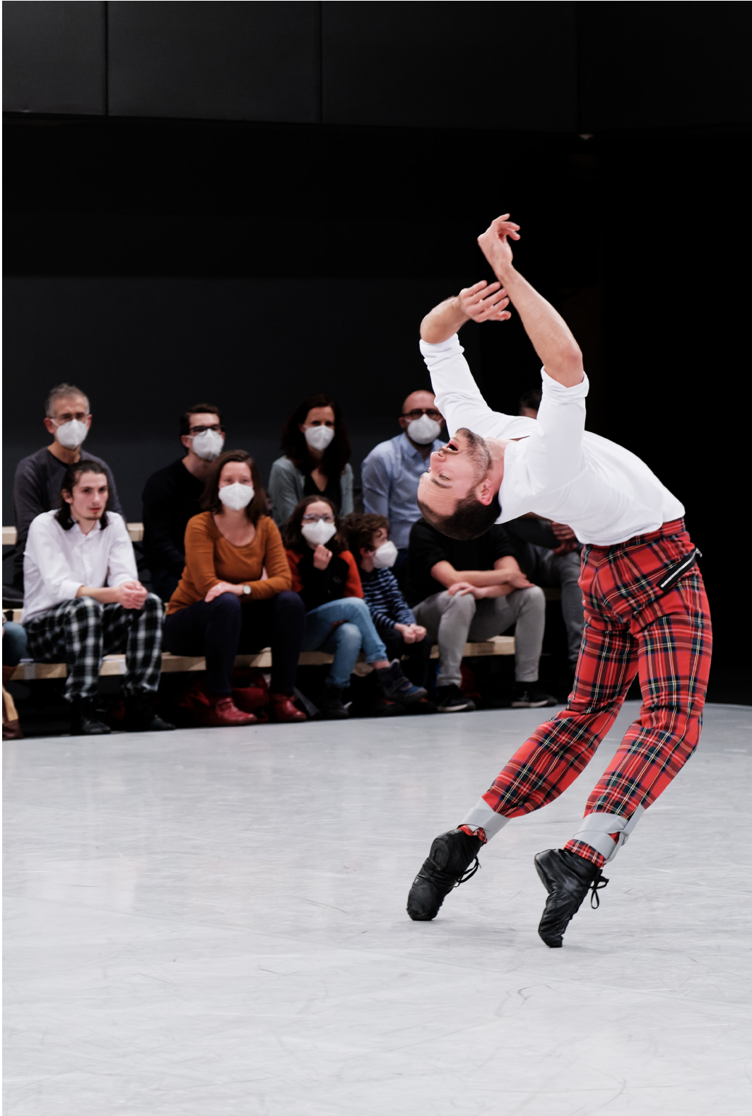
Kamuyot , Ohad Naharin BOnR