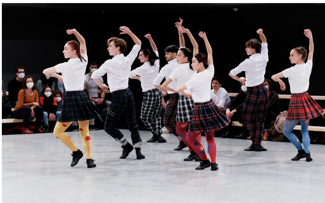
Kamuyot, Ohad Naharin BOnR

Kamuyot est une pièce chorégraphique pour jeune public créée en 2003 par Ohad Naharin, chorégraphe de renom et directeur artistique de la Batsheva Dance Company.