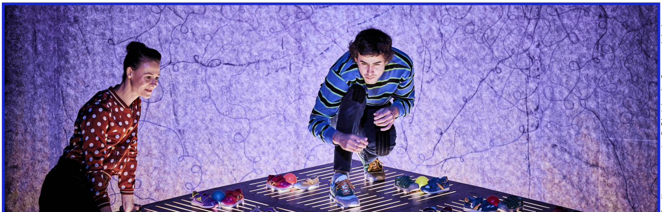
Bastien sans main.

Mais la maîtresse n'avait pas le mot. Rebecca, la maîtresse préférée de ses élèves, la seule dans l'école qui savait compter jusqu'à 69 à reculons, qui connaissait des chansons en anglais et en chinois et qui arrivait en une seconde à ouvrir la fermeture éclair des enfants bloquée dans leurs veste... Dire ce qu'était Bastien elle ne le savait pas.