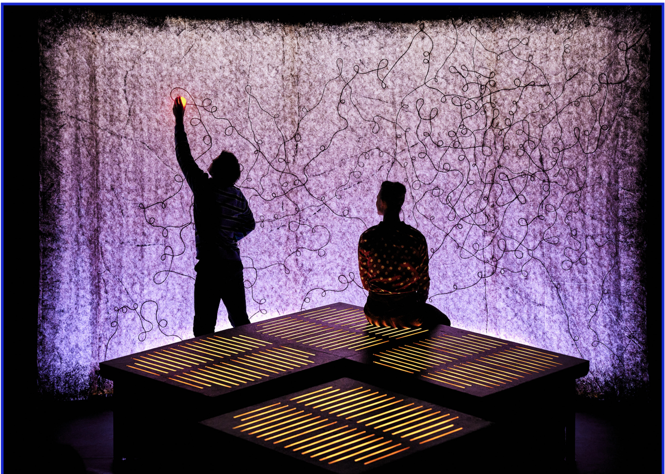
Bastien sans main.

« Sensible et drôle , ce spectacle [...] est servi par une mise en scène poétique [...] » La Manche Libre